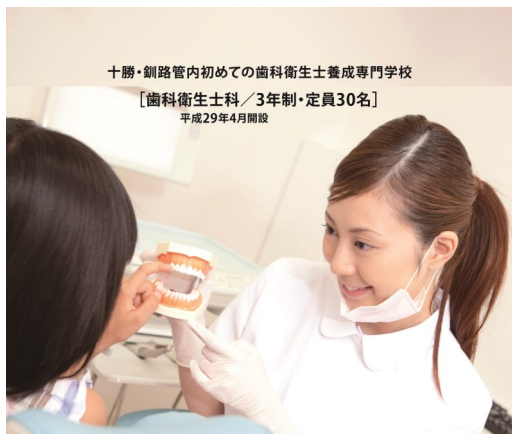
十勝・釧路管内初めての歯科衛生士養成専門学校 [歯科衛生士科/3年制・定員30名] 平成29年4月開設